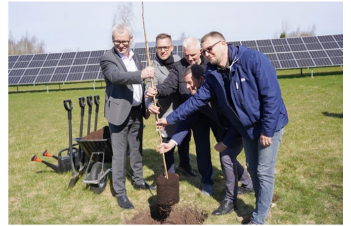
Utilitase kaugküttegaama laienduse avamise auks isutati õunapuud.