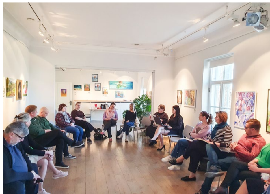
Betti Alveri muuseumis kogunes turismiteemaline ümarlauda.

Ühtlasi lepitati kokku, et järgmine kokku-