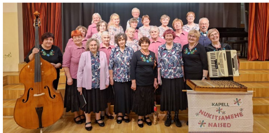
Kaarepere rahvamaja Laulunaiste ja Nukitsamehe Naiste kapell.

Kõigepealt kostitati meid maitsva lõunasöödiga, siis tehti giidituur Mõniste Talurahvamuseumis ja Eesti Kodu mälestuskompleksis ning oligi aeg pidu pidada. Sõpruskohtumisel esinesime üksteisele oma uuema repertuaariga. Laulsime ka koos, sest kui Mehkarid meil käisid, siis sai neilt paar laulu laenatud. Muusika ja tantsuga läks aeg