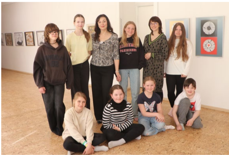
Näitusel osalejad juhendajatega.

Joonistustel, kus on kujutatud teekann ja kortsutatud paber on tausta kaunistamiseks kasutatud zentangle ja neurograafika joonistamise võtteid. Mõlemad tehnikad on rahusta-