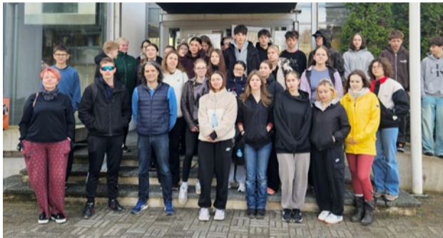
Noortevahetuse programm oli praktiline ja kaasav.

Lisaks õppimisele pakkus projekt võimalust kultuuridevaheliseks kogemuseks – noored