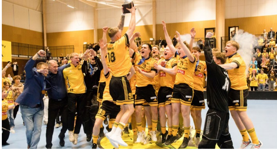
SK Tähe võidujuovastus Eesti meistriks tuleku puhul.

SK Tähe kodulehel on öeldud, et klubi tiimiliikmed, toetajad ja fännid on justkui kuued mängijaks väljakul ning nende panus on uskumatu. Üksnes fännide toetusest võiduks muidugi ei piisa, mängijad peavad ka ikka tasemel olema. „Esindusmeeskond on mänginud lõppenud hooajal erinevates liigades kokku 45 kohtumist ja läbinud ligemale 10 000 kilomeetrit. Juba see näitab, kui suur töö